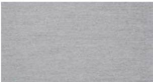
Grey chiné — Natté