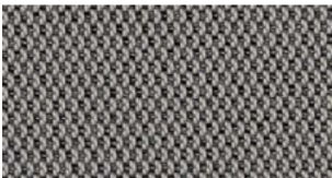
Charcoal, grey — Lopi