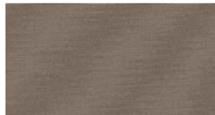
Taupe — Solids