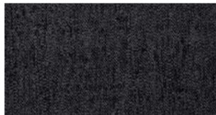
Sooty, anthracite — Chartres