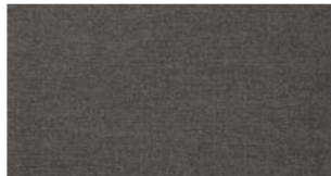
Dark taupe — Natté