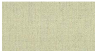
Moss, light green — Heritage