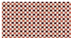
Craps, orange — Domino