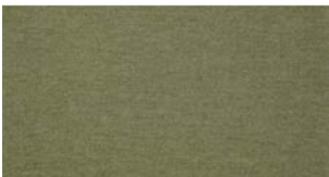
Leaf green — Heritage