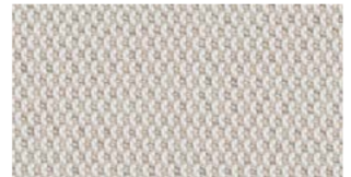
Marble, warm white — Lopi