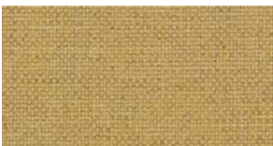
Amber, yellow — Natté