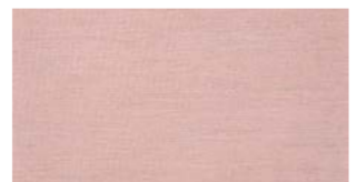
Blush, pink — Solids