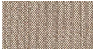
Coconut, beige — Savane