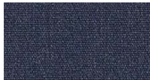
Indigo, blue — Heritage