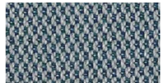
Nenuphar, blue/grey — Lopi