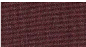
Carmine, red — Natté