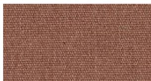
Rust, orange — Heritage